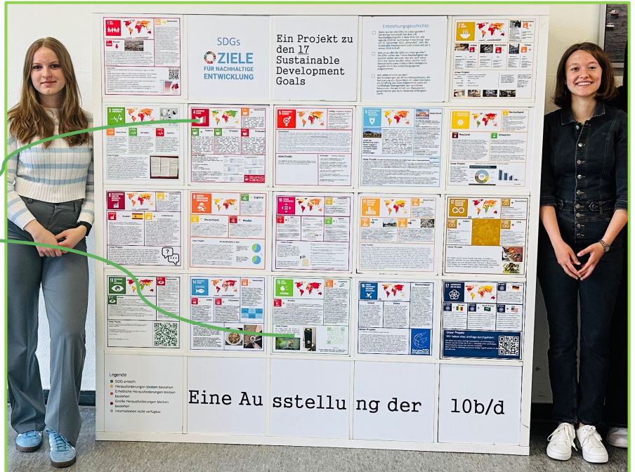
Eine Ausstellung der 10b/d